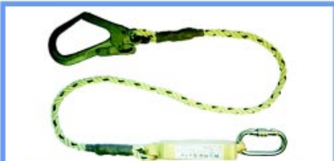
WSF210 สายช่วยชีวิตพร้อมอุปกรณ์สุดขีดแรงกระแทก ประกอบด้วยคาราบิเนอร์และตะขอสับขนาดใหญ่ เชือกขนาด 12 mm ยาว 1.8 เมตร ความยาวโดยรวม 2 เมตร อุปกรณ์สุดขีดแรงยาวสูงสุด 1.5 เมตร มาตรฐาน CE0120 EN355