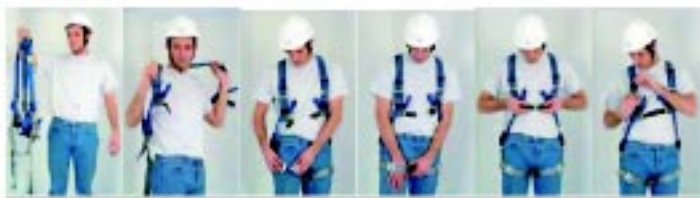
ขั้นตอนการสวมเข็มขัดนิรภัยที่ถูกต้อง

เข็มขัดนิรภัยแบบเต็มตัว น้ำหนักเบา ถอดและใส่ได้ง่าย ผลิตจากวัสดุโพลีเอไมด์กว้าง 45 mm.อ่อนนุ่มกระชับลำตัว อุปกรณ์จุดเกี่ยว ใช้ประกอบแบบสวมเร็ว ทำให้ใช้งานได้ไม่ยุ่งยาก เข็มขัดนิรภัยเต็มตัวทุกรุ่นผ่านมาตรฐานยุโรป CE0120 ใช้สำหรับการทำงานบนที่สูงทุกประเภท อาทิ งานซ่อมบำรุง งานทำความสะอาด งานก่อสร้าง รวมถึงงานช่วยชีวิต