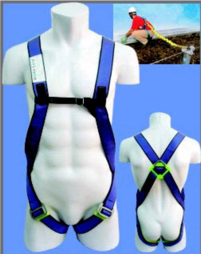
WSF110 เข็มขัดนิรภัยแบบเต็มตัวชนิดจุดยึดเดี่ยวด้านหลัง เหมาะสำหรับงานป้องกันการตกทั่วไป มาตรฐาน CE0120 EN361