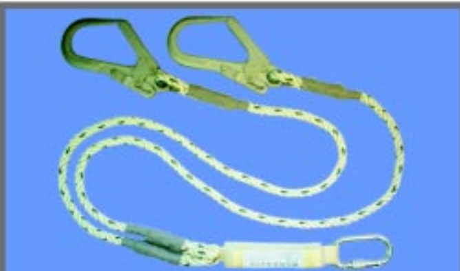
WSF220 สายช่วยชีวิตชนิดเส้นคู่พร้อมอุปกรณ์สุดขีดแรงกระแทก ประกอบด้วยคาราบิเนอร์ 1 อัน และตะขอ 2 อัน เชือกขนาด 12 mm 2 คู่ ยาว 1.8 เมตร ความยาวโดยรวม 2 เมตร อุปกรณ์สุดขีดแรงยาวสูงสุด 1.5 เมตร เหมาะสำหรับงานเป็นป้ายโครงสร้างอาคาร นั่งร้าน มาตรฐาน CE0120 EN355