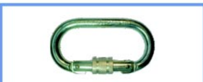
WSF310 คาราบิเนอร์ วัสดุกล้าไนซ์ปากเปิด 18 mm รับแรงได้ 220 กิโลกรัม ชนิดเกลียวหมุน มาตรฐาน CE0120 En362