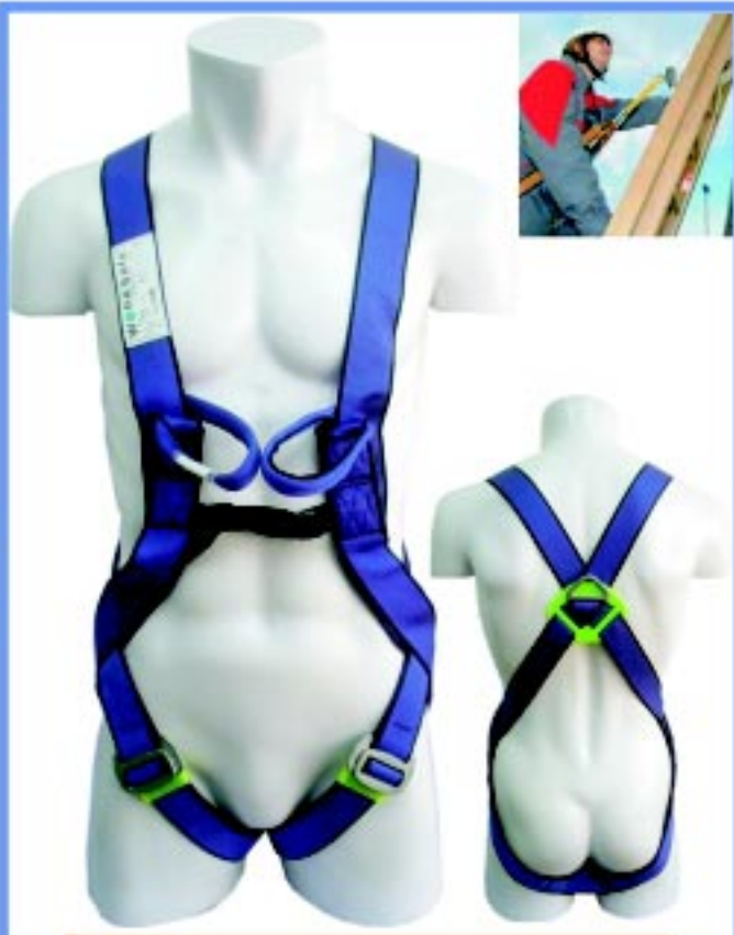
WSF120 เข็มขัดนิรภัยแบบเต็มตัวชนิดจุดยึดเดี่ยวด้านหลัง และจุดยึดด้านหน้าสำหรับงาน rescue เหมาะสำหรับงานป้องกันการตกทั่วไปและrescue มาตรฐาน CE0120 EN361