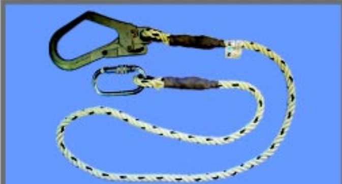
WSF211 สายช่วยชีวิตขนาด 2 เมตร เชือก 12 mm ประกอบด้วย คาราบิเนอร์และตะขอสับวัสดุ Hotdrip Galvalnized ไม่เป็นสนิม มาตรฐาน CE0120 EN355