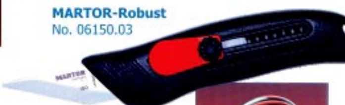
MARTOR-Robust No. 06150.03

คัทเตอร์สำหรับงานอุตสาหกรรมหนัก สามารถปรับความยาวของใบมีดได้ตามต้องการ และเก็บใบมีดอัตโนมัติเมื่อตัดชิ้นงานเสร็จ ใช้กับใบมีดหนา 1.80 มม. มีแบบให้เลือกตามความเหมาะสมของชิ้นงาน และสามารถลับใบมีดให้คมด้วยหินลับมีดได้ *GS - TESTED FOR SAFETY*