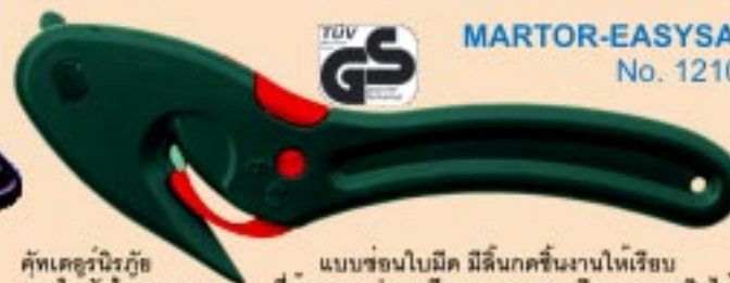
MARTOR-EASYSAFE No. 121001

คัทเตอร์นิรภัย สำหรับงานหนัก ปุ่มเลื่อนเปิดใบมีดอยู่ด้านบน จับถนัดทั้งมือซ้ายและมือขวา ตัวจับทำจากสังกะสีหล่อ สามารถปรับความยาวใบมีดได้ ใช้กับใบมีด No.5232.70 *GS - TESTED FOR SAFETY*