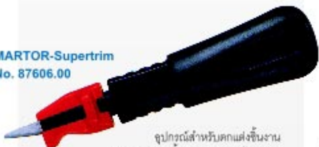
MARTOR-Supertrim No. 87606.00

อุปกรณ์สำหรับตกแต่งชิ้นงาน สามารถใช้กับชิ้นงานพลาสติก ไม้ โลหะ กระดาษ พิล์ม ใบมีดแบบปลายแหลมจึงเข้ามุมชิ้นงานได้ง่าย ตัวตัวจับแบบกระชับผู้ถือ สามารถปรับความยาวได้ตามความกว้างของข้อมือแต่ละคน ใช้ใบมีด No.11