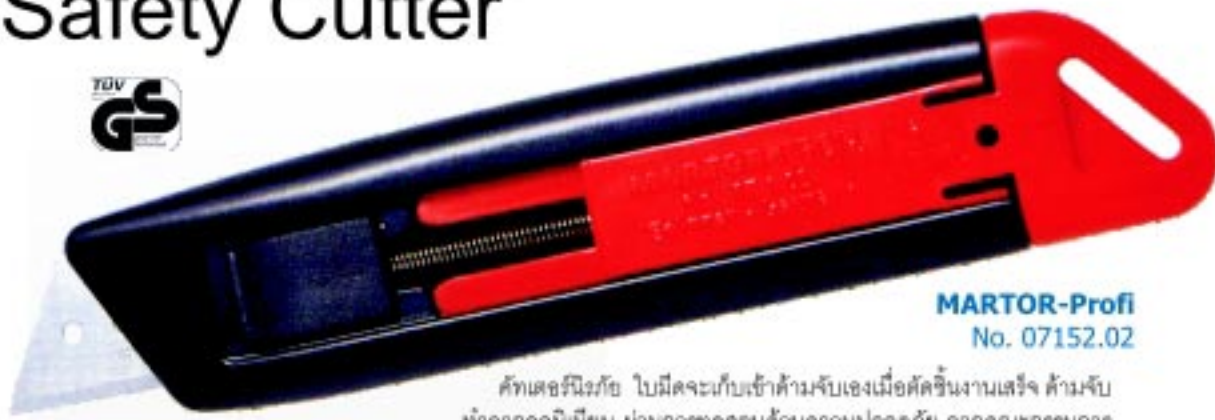
MARTOR-Profi No. 07152.02

คัทเตอร์นิรภัย ใบมีดจะเก็บเข้าตัวจับเองเมื่อตัดชิ้นงานเสร็จ ตัวจับทำจากอลูมิเนียม ผ่านการทดสอบด้านความปลอดภัย จากคณะกรรมการของ German Safety Control Board (TUV) ใช้กับใบมีด No.5232.70 และ No.56.70 *GS - TESTED FOR SAFETY*