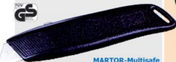
MARTOR-Multisafe No. 08152.00

คัทเตอร์นิรภัยแบบซ่อนใบมีด พร้อมชิ้นเหล็กเซาะเทปขาว ไรคม เอนกประสงค์ใช้ได้กับงานตัดพลาสติกโฟม งานแกะกล่อง ตัดสายรัดกล่อง เปลี่ยนใบมีดโดยป้อนหมุน ใช้กับใบมีด 37040 หนา 0.40 มม.