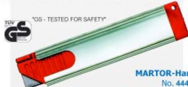
MARTOR-Handy No. 444.02

คัทเตอร์นิรภัย ตัวจับอลูมิเนียม ใช้งานได้ดีทั้งผู้ที่ถนัดมือซ้ายและมือขวา *GS - TESTED FOR SAFETY* ใช้กับใบมีด No.56.70 และ No.5232.70