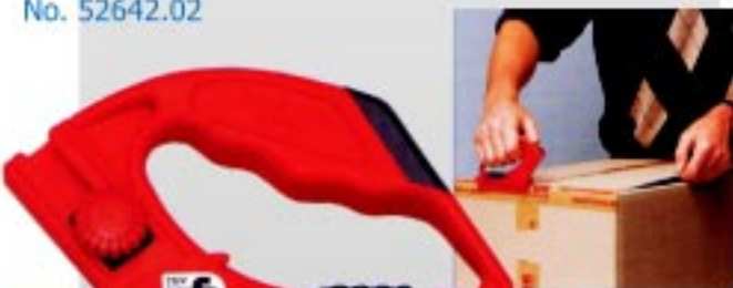
MARTOR-Automatic No. 52642.02

คัทเตอร์สำหรับงานอุตสาหกรรมหนัก สามารถปรับความยาวของใบมีดได้ตามต้องการ และเก็บใบมีดอัตโนมัติเมื่อตัดชิ้นงานเสร็จ ใช้กับใบมีดหนา 1.80 มม. มีแบบให้เลือกตามความเหมาะสมของชิ้นงาน และสามารถลับใบมีดให้คมด้วยหินลับมีดได้ *GS - TESTED FOR SAFETY*