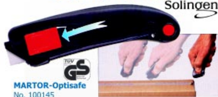
MARTOR-Optisafe No. 100145

คัทเตอร์นิรภัย ใบมีดจะเก็บเข้าตัวจับเองเมื่อตัดชิ้นงานเสร็จ ตัวจับทำจากอลูมิเนียม ผ่านการทดสอบด้านความปลอดภัย จากคณะกรรมการของ German Safety Control Board (TUV) ใช้กับใบมีด No.5232.70 และ No.56.70 *GS - TESTED FOR SAFETY*