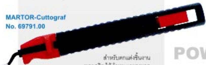
MARTOR-Cuttograf No. 69791.00

สำหรับตกแต่งชิ้นงาน พลาสติก ไม้ โลหะ และกระดาษ ใบมีดแบบ SAFETY ป้องกันการถูกใบมีดบาดจากการทำงาน ใบมีดหมุนได้ 360 องศา สามารถตัดแต่งชิ้นงานที่มีความโค้งงอได้ดี และสามารถเข้าตัดแต่งชิ้นงานส่วนที่เป็นช่องแคบได้ ตัวตัวจับแบบยาว สามารถเก็บใบมีดในช่องเก็บที่ตัวจับได้ ใช้กับใบมีด No.791.52