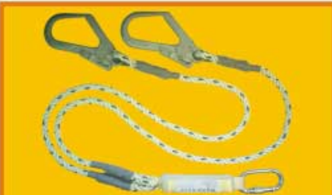
WSF220 สายช่วยชีวิตชนิดเส้นคู่พร้อมอุปกรณ์สุดแข็งแรงกระแทก ประกอบด้วยคาราบิน่า 1 อัน และตะขอ 2 อัน เชือกขนาด 12 mm 2 คู่ ยาว 1.8 เมตร ความยาวโดยรวม 2 เมตร อุปกรณ์สุดแข็งแรงยาวสูงสุด 1.5 เมตร เหมาะสำหรับงานเป็นป้ายโครงสร้างอาคาร นั่งร้าน มาตรฐาน CE0120 EN355