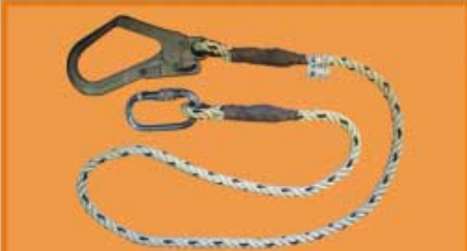
WSF211 สายช่วยชีวิตขนาด 2 เมตร เชือก 12 mm ประกอบด้วย คาราบิน่าและตะขอสับวัสดุ Hotdrip Gravalnized ไม่เป็นสนิม มาตรฐาน CE0120 EN355