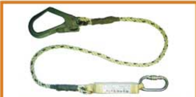
WSF210 สายช่วยชีวิตพร้อมอุปกรณ์สุดแข็งแรงกระแทก ประกอบด้วยคาราบิน่าและตะขอสับขนาดใหญ่ เชือกขนาด 12 mm ยาว 1.8 เมตร ความยาวโดยรวม 2 เมตร อุปกรณ์สุดแข็งแรงยาวสูงสุด 1.5 เมตร มาตรฐาน CE0120 EN355