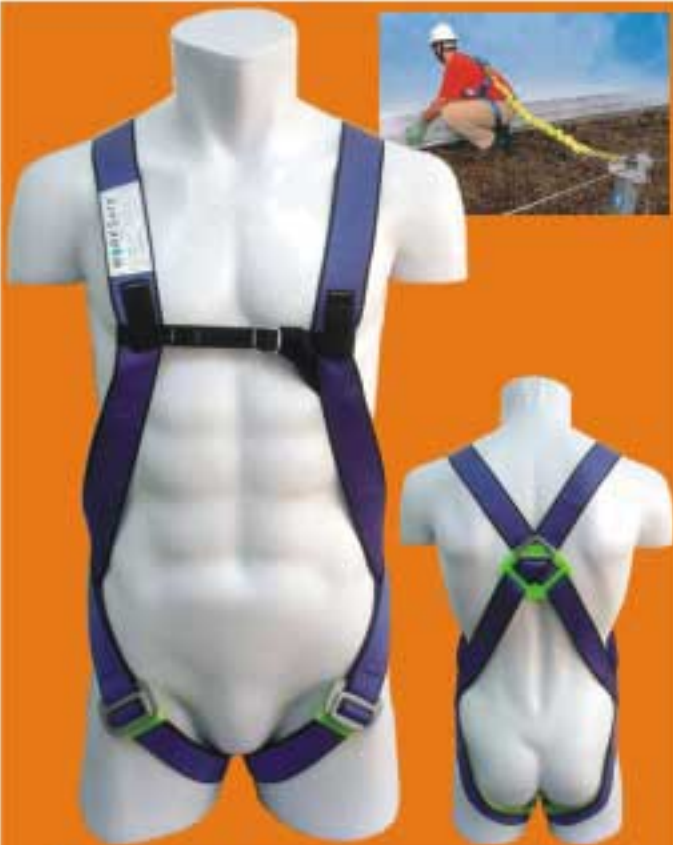
WSF110 เข็มขัดนิรภัยแบบเต็มตัวชนิดจุดยึดเดี่ยวด้านหลัง เหมาะสำหรับงานป้องกันการตกทั่วไป มาตรฐาน CE0120 EN361