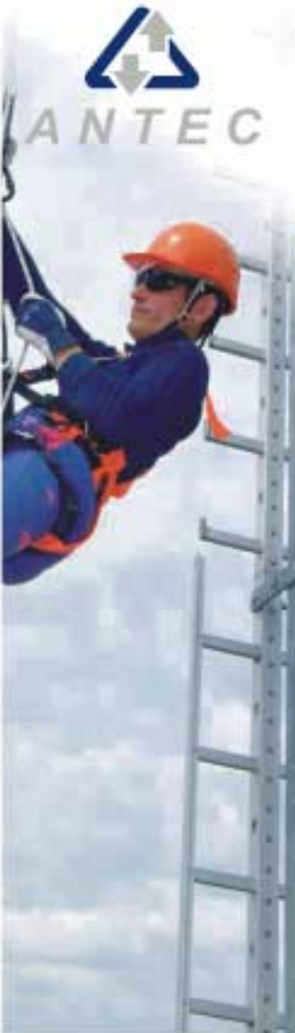
Safety rope เชือกนิรภัย