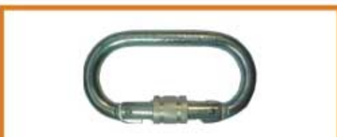
WSF310 คาราบิน่า วัสดุกล้าในซิปปากเปิด 18 mm รับแรงได้ 220 กิโลกรัม ชนิดเกลียวหมุน มาตรฐาน CE0120 En362