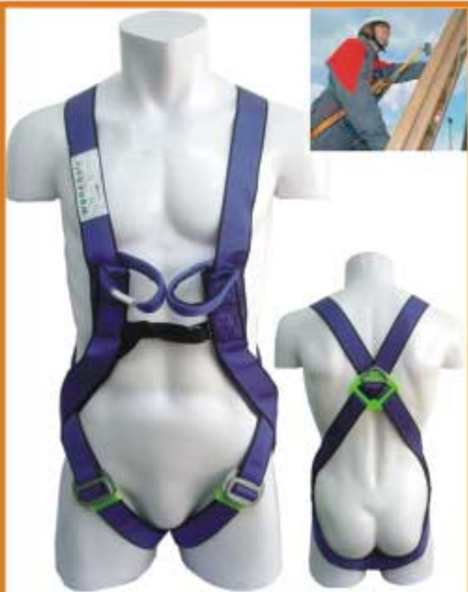
WSF120 เข็มขัดนิรภัยแบบเต็มตัวชนิดจุดยึดเดี่ยวด้านหลัง และจุดยึดด้านหน้าสำหรับงาน rescue เหมาะสำหรับงานป้องกันการตกทั่วไปและrescue มาตรฐาน CE0120 EN361