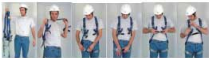
ขั้นตอนการสวมเข็มขัดนิรภัยที่ถูกต้อง

เข็มขัดนิรภัยแบบเต็มตัว น้ำหนักเบา ถอดและใส่ง่าย ผลิตจากวัสดุโพลีเอไมด์กว้าง 45 mm.อ่อนนุ่มกระชับลำตัว อุปกรณ์จุดเกี่ยว ใช้ประกอบแบบสวมเร็ว ทำให้ใช้งานได้ไม่ยุ่งยาก เข็มขัดนิรภัยเต็มตัวทุกรุ่นผ่านมาตรฐานยุโรป CE0120 ใช้สำหรับการทำงานบนที่สูงทุกประเภท อาทิ งานซ่อมบำรุง งานทำความสะอาด งานก่อสร้าง รวมถึงงานช่วยชีวิต